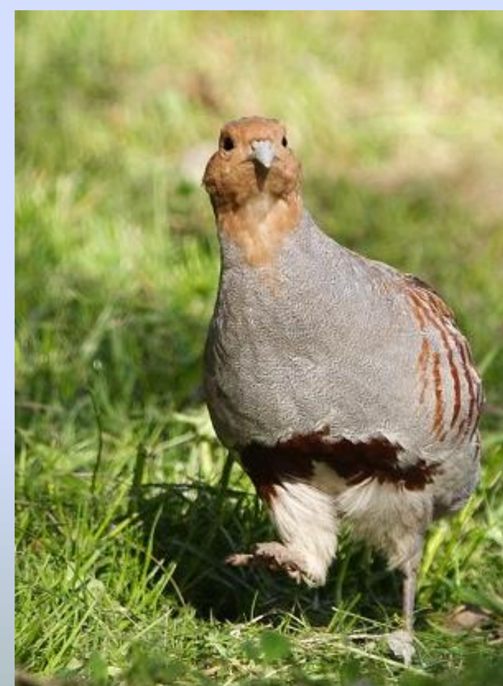
FOTOGRAFIE: Koroptev polní © Ivan Mikšík

Celkový počet druhů polních ptáků vypovídá o stavu biodiverzity - tedy čím více druhů, tím lépe. Na zemi hnízdící polní ptáci jsou úspěšností hnízdění velmi závislí na způsobu zemědělského hospodaření. Přítomnost koroptve polní , jako citlivého bioindikátoru, pak ukazuje na celkový stav krajiny, zejména tedy na zastoupení vhodných krajinných prvků a míru šetrného zemědělského hospodaření.